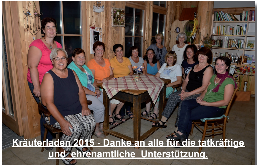
Kräuterladen 2015 - Danke an alle für die tatkräftige und ehrenamtliche Unterstützung.

einem Besuch in der Kräuterausstellung „Kräuterwissen erLeben“ in Hirschbach erfuhren sie Wissenswertes zum Thema Kräuter und wanderten entlang des Bergkräuterwanderweges. Beim Kräutergarten durften sich die Kinder eine Pizza, natürlich gewürzt mit heimischen Kräutern, selbst zubereiten.