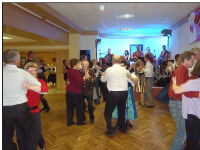
Die Freiwillige Feuerwehr Hirschbach bedankt sich bei allen Besuchern und hofft auf ein Wiedersehen beim nächsten Feuerwehrball in Hirschbach.

Da jeder Einsatz individuell verläuft, ist es wichtig Übungen abzuhalten, um auf den Ernstfall gut vorbereitet zu sein. Insgesamt wurden daher 15 Übungen von 132 Mann zu 310 Stunden durchgeführt. Darin sind die Bewerbungsgruppen- und Feuerwehrjugendgruppenübungen, sowie die Übungen und Schulungen in den verschiedenen Teilbereichen, wie Lotsen- und Nachrichtendienst, Strahlenschutz, Atemschutz, Maschinisten, usw. nicht enthalten.