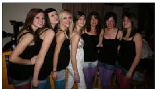
Für den optischen Aufputz und eine mehr als beachtliche Tanzeinlage sorgten die Showdancers.