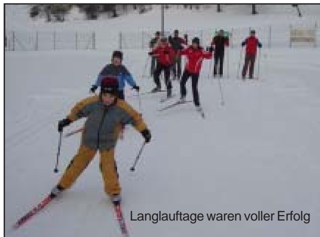
Langlaufwoche waren voller Erfolg

Für die Sektion Langlauf Ewald Pirklbauer