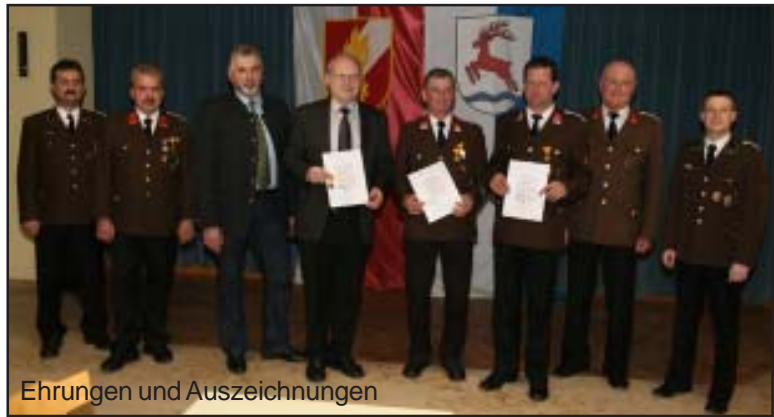
Ehrungen und Auszeichnungen