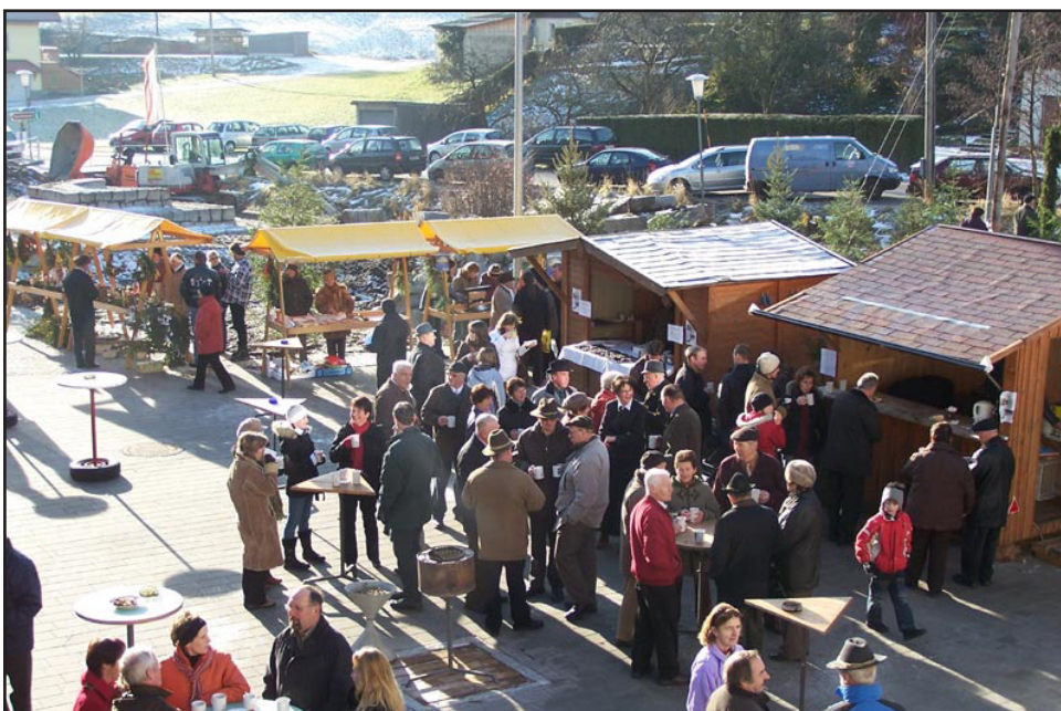
Bei prächtigem Wetter beehrten uns wieder zahlreiche Besucher beim traditionellen Weihnachtsmarkt - diesmal beim neuen Gemeindeamt!