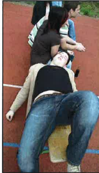
Nach dem Reden — etwas erschöpft