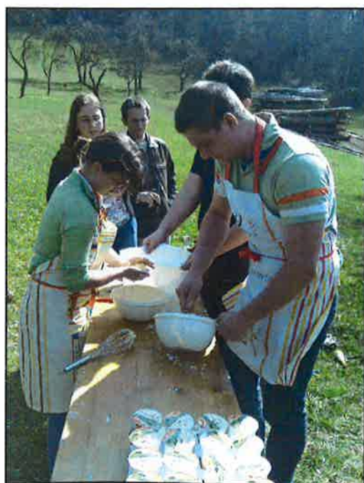
Die Hirschbacher Teams bei der IQ Rallye in Neumarkt am Ostermontag