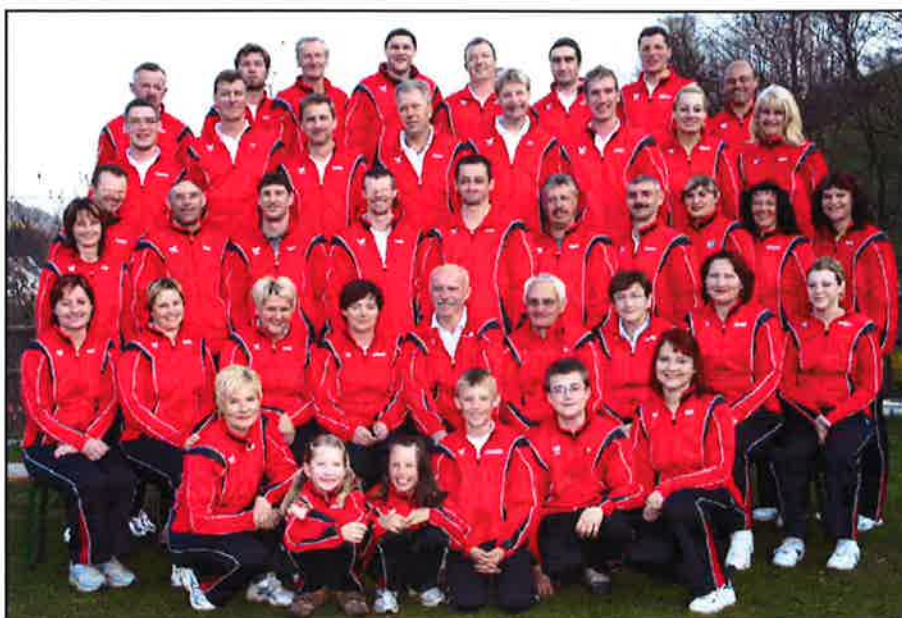
Neue Trainingsanzüge - Seit einigen Wochen glänzen die Sportler der Sportunion Hirschbach in neuen Trainingsanzügen.

Maibaum umlassen erfolgt am 1. Juni 2007, ab 17:00 Uhr!!