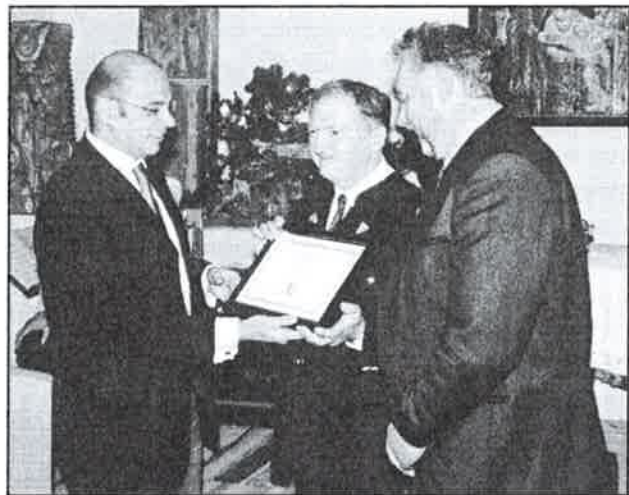
Überreichung des Dekretes „Museum des Monats“

Hexenbücher, letztere natürlich nur, wenn sie im Haushalt nicht mehr gebraucht werden.