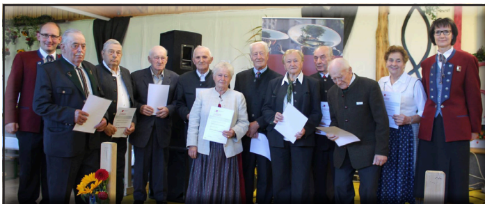
Überreichung einer Anerkennungsurkunde mehr als 50 Jahre bzw. für 60 Jahre Vereinsmitgliedschaft

Somit kein Wunder, dass wir uns über ein gelungenes Jubiläumsfest freuen. Herzlichen Dank für den zahlreichen Besuch und die großartige ehrenamtliche Unterstützung aller HelferInnen, die so ein Fest erst ermöglichen.